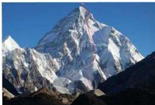
“Ruta de ascenso de Kukuczka y Tadeusz Piotrowski en el K2. Año 1986.”

Ahora, hablaré sobre Wojtek Kurtyka. Fue uno de los montañistas polacos más famosos en el mundo y tenía un gran carisma. Wojtek renunció a las grandes expediciones al Himalaya y comenzó a escalar en la cordillera más alta del mundo en estilo alpino. Tuvo varios logros importantes: Changabang por la cara sur (1978), cara este del Dhaulagiri (1980), una nueva ruta en el Gasherbrum I (1983), la travesía del Broad Peak con Kukuczka (1984), la cara occidental del Gasherbrum IV (llamada Shining Wall, 1985), la cara este del la Torre Sin Nombre de Trango (1988), la cara oriental media del Cho Oyu (1990) y la cara este del Shisha Pangma (también en 1990).