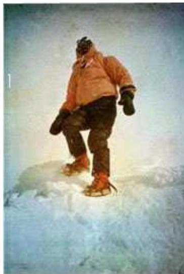
“Kurtyka en la cima del Gasherbrum IV.”

Estos dos ascensos invernales de Jerzy Kukuczka fueron un éxito enorme: por primera vez un solo hombre había realizado dos ascensos invernales a ochomiles espaciados por 300 kilómetros uno de otro en un lapso de sólo 25 días.